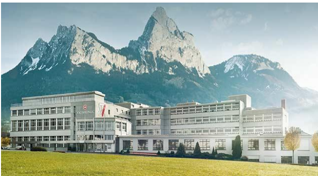
Abb. 1: Hauptsitz Victorinox, Ibach-Schwyz/Schweiz

Victorinox ist seit über 130 Jahren als Messerschmiede in der Schweiz bekannt. Seit den 1890er Jahren haben die berühmten Schweizer Taschenmesser mit dem prägnanten Logo die Welt erobert. Heute ist Victorinox ein globales Unternehmen mit den Produktparten: Schweizer Taschenmesser, Haushalts- und Berufsmesser, Uhren, Reisegepäck und Parfüm. Daneben betreibt Victorinox rund 70 eigene Retail-Stores und Shop-in-Shops, sowohl in der Schweiz als auch im Ausland. Das Schweizer Taschenmesser gilt als Kernprodukt und ist wegweisend in der Entwicklung aller Produktkategorien.